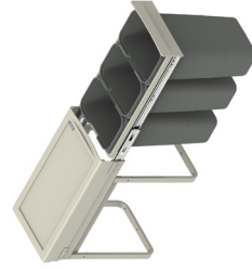
JC604 wysoki 3 x 91