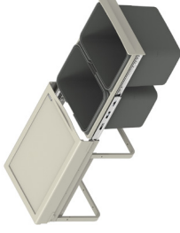
JC602 niski 2 x 151