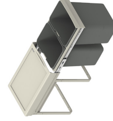
JC602 wysoki 2 x 201