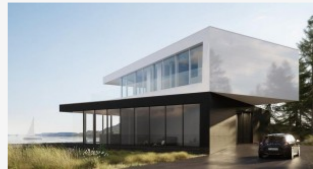
DOM CZARNO NA BIAŁYM