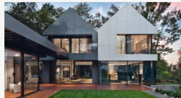
DOM Z WIDOKIEM NA MAŁOWNICZĄ ZATOKĘ GDAŃSKĄ