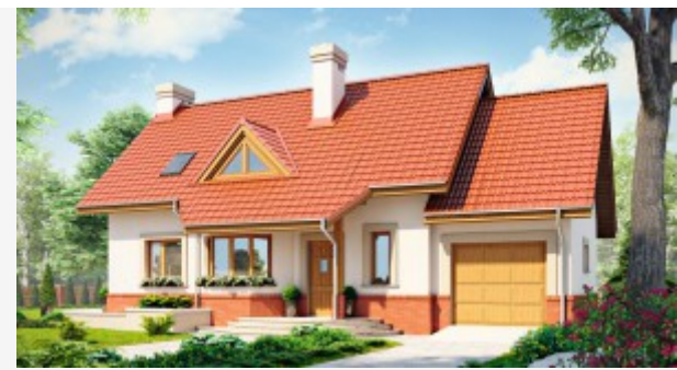
MAŁY DOM Z PODDASZEM UŻYTKOWYM I GARAŻEM

Nie ma jeszcze komentarzy. Kliknij i dodaj pierwszy!